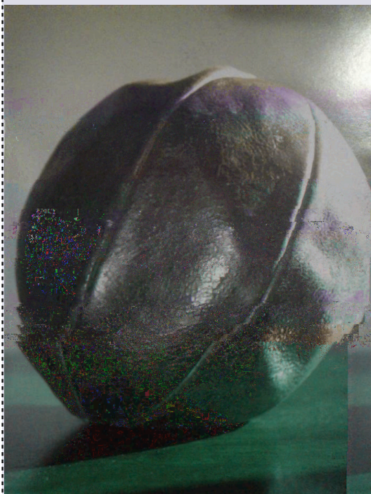
Zupanja – koljevka hrvatskog nogometa, Zupanja, 2005.