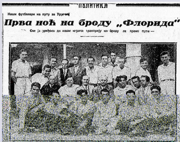
, 26. 06. 1930, . 7950 – XXVII